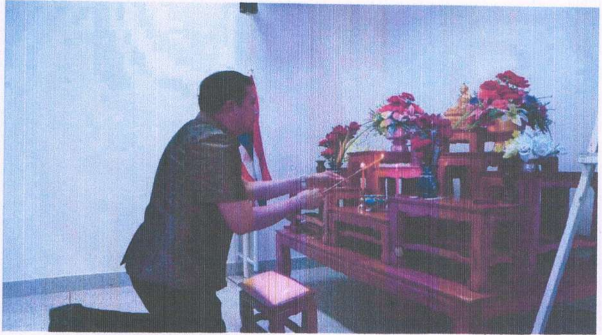
ภาพกิจกรรม โครงการพัฒนาคุณธรรม จริยธรรม ของบุคลากรเทศบาล ประจำปี ๒๕๖๘